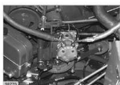
Remove the compressor drive belt (2). Separate the cable plug from the compressor. Loosen the protective tube from the engine. Unscrew the clips from the air conditioning hoses. Loosen the set collar and pull the compressor off. Take levelling washers into consideration. (Fig. 2)