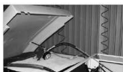
CAUTION! The hoses must not be loosened and / or bent.